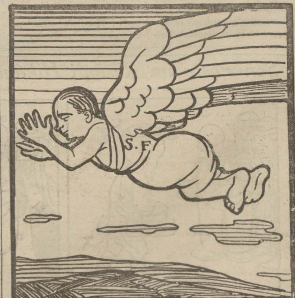
S. F. nin ruhu — İşte şimdi serbestime kavuştum!