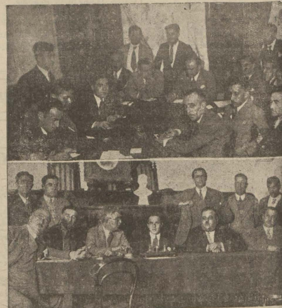
Spor ihtilâfının halli için dün bir hazırlık toplantısı yapıldı [ Yazısı dördüncü sayfamızdadır ]

Halk Fırkası Teşkilâtına Ait Faaliyet Haberleri, Bu Teşkilâta Memur Heyetlerin Hareketleri Hakkındaki Tafsilât 3 üncü Sayfamızdadır.